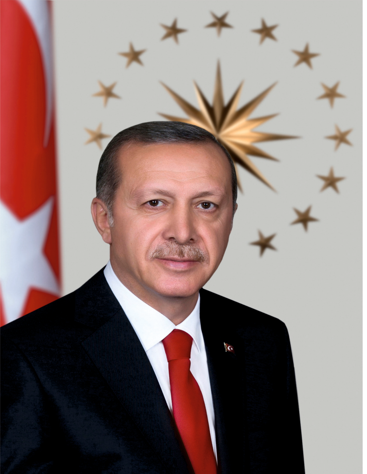
RECEP TAYYİP ERDOĞAN CUMHURBAŞKANI