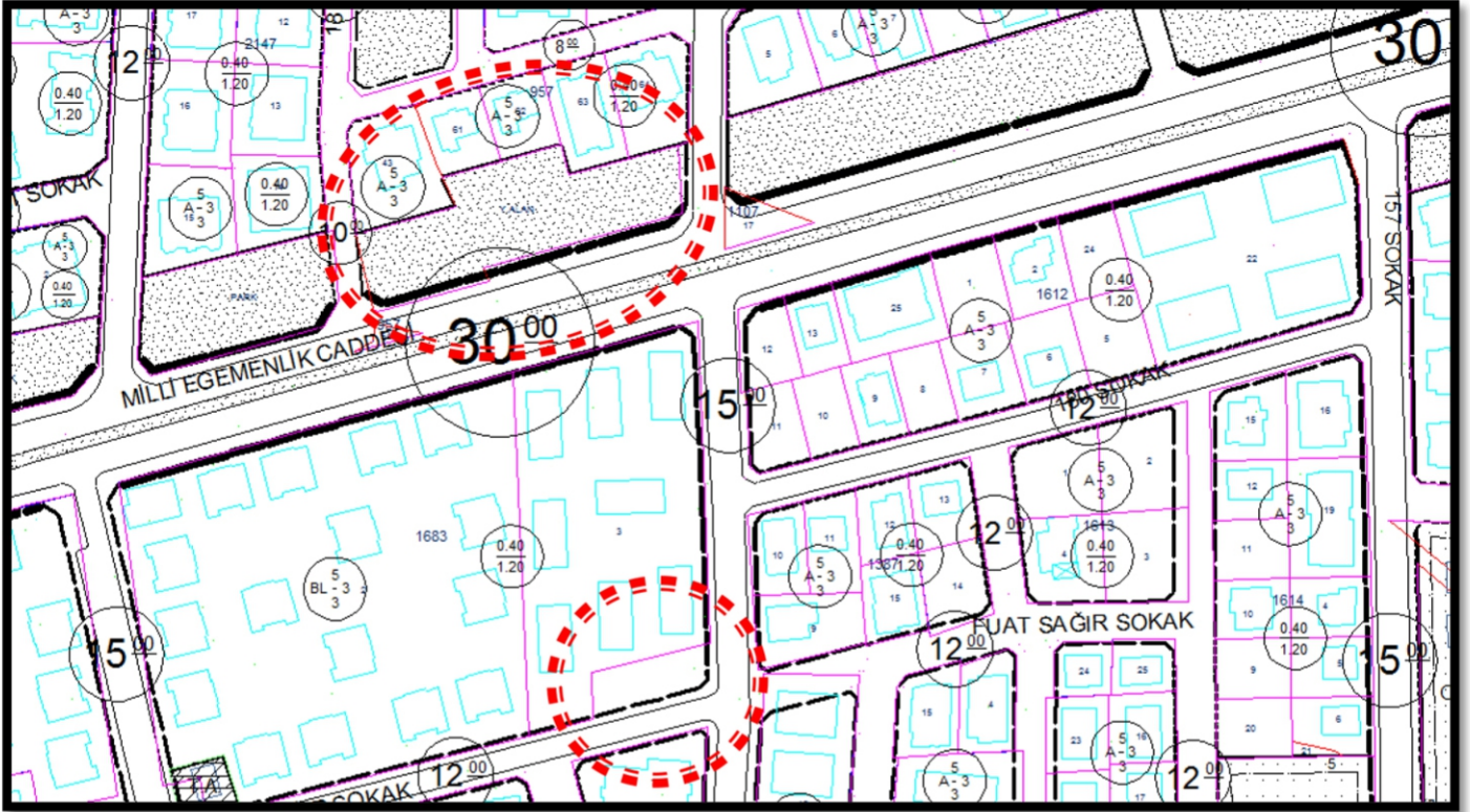
RESİM 7: UYGULAMA İMAR PLANI TADILAT ÖNCESİ